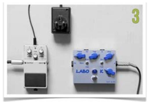
BRANCHEMENT DE LA GUITARE SUR LA LABO ★ K