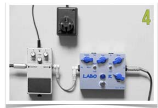
INTERCONNEXION DES DEUX PEDALES